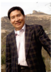
赵郅安 教授、硕士生导师 学科带头人 教育部基础教育专家