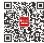
西京研究生微信二维码