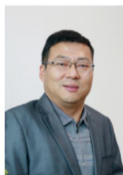
苗宗成 教授、博士 陕西省科技创新领军人才 陕西省高校 青年杰出人才支持计划