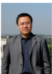
尤著宏 教授、博士 博士生导师 国家优青、香江学者