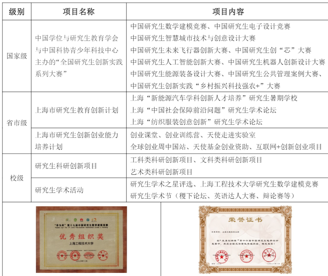
研究生主要学术创新实践项目

2021 年，学校共有 12 项研究生创新创业能力培养计划孵化项目获上海市立项，在同类高校中排名第二。