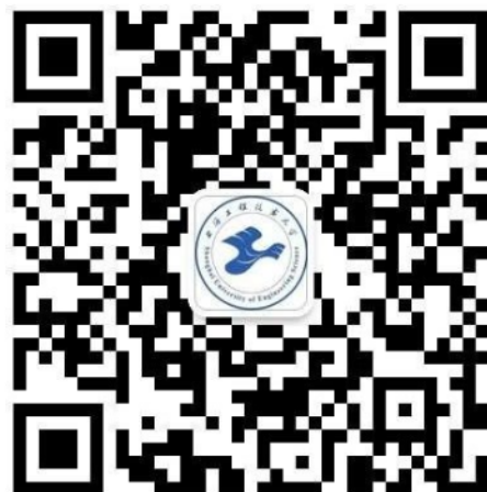
“上海工程技术大学研究生教育”