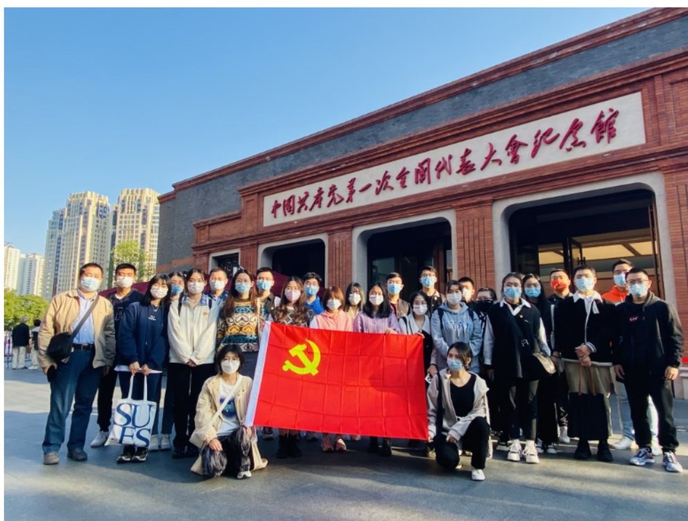
马克思主义学院研究生参观中国共产党第一次全国代表大会纪念馆