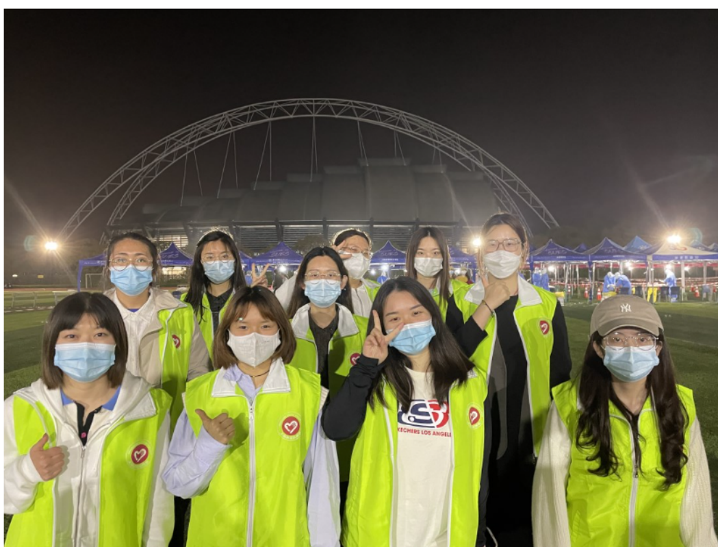
马克思主义学院研究生志愿者在抗疫前线展现青春风采