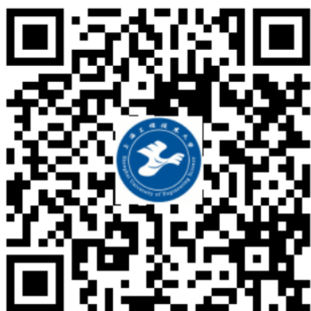
“上海工程技术大学研招网”