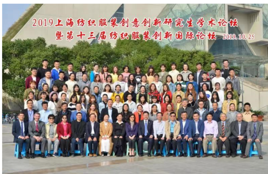
上海纺织服装创意创新研究生学术论坛暨纺织服装创新国际论坛照片