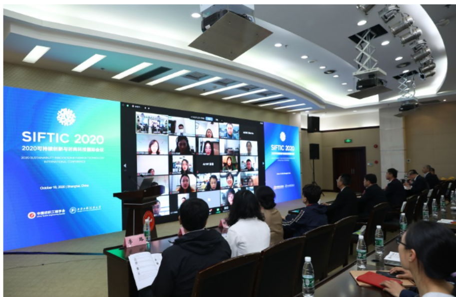
2020 可持续创新与时尚科技国际会议照片