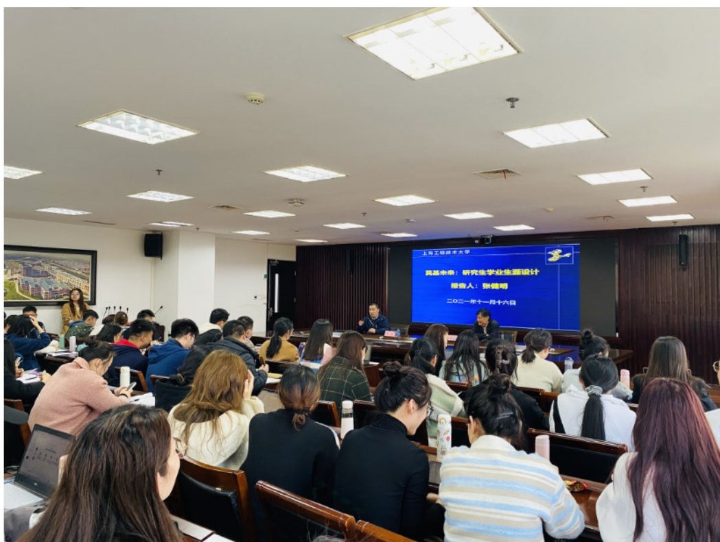
马克思主义学院研究生在聆听学术讲座