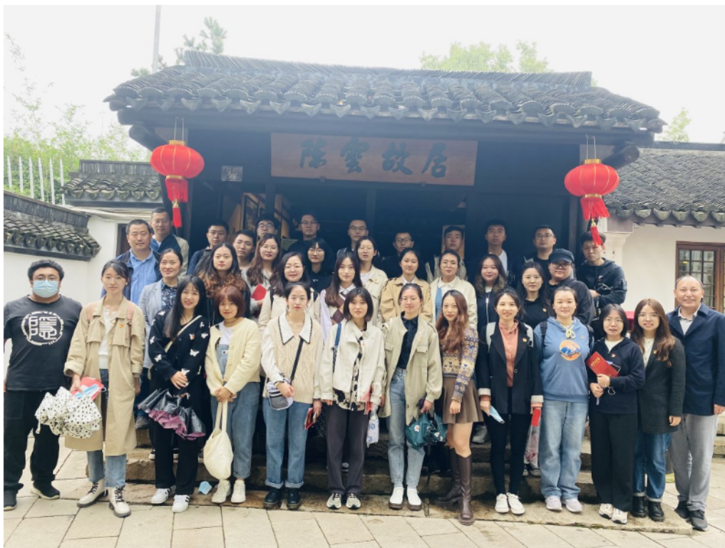
马克思主义学院到陈云纪念馆开展现场教学，研究生们在陈云故居前留影。