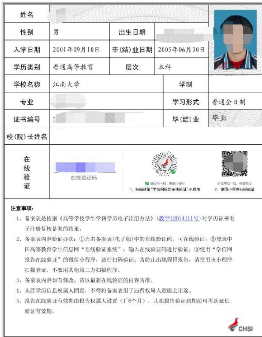
6-1 《教育部学历证书电子注册备案表》示例（2000年之后毕业）