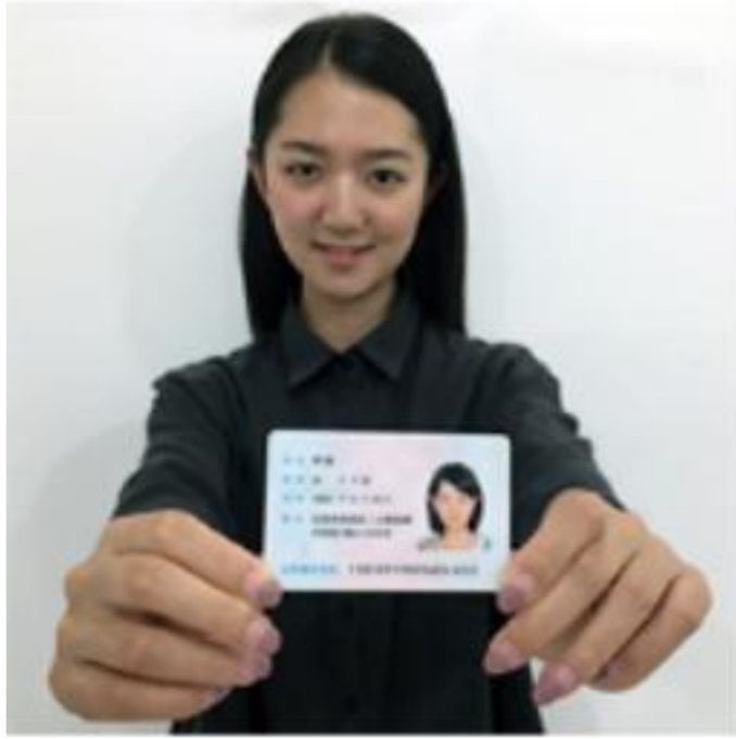
4 本人手持身份证照片示例