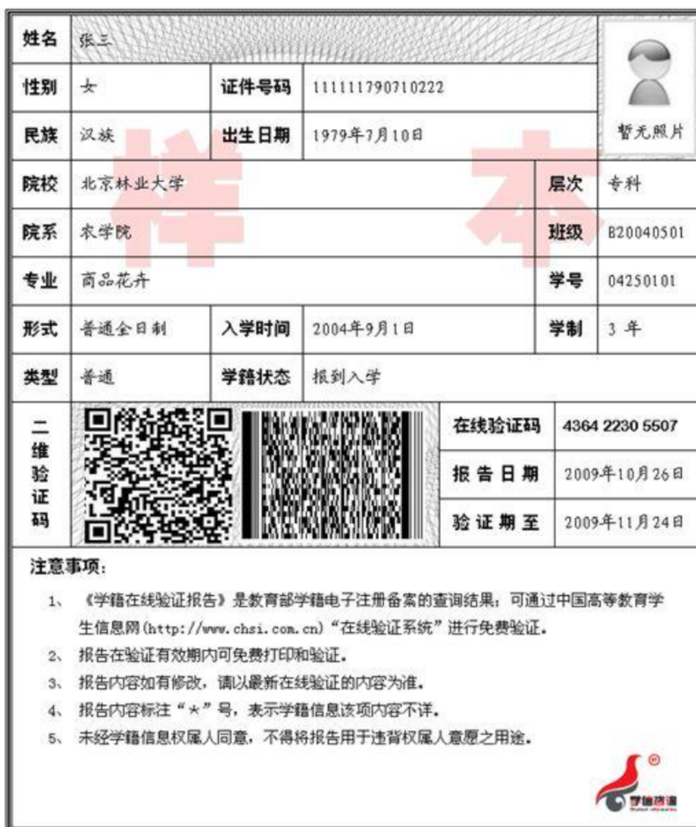
6-3 《教育部学籍在线验证报告》示例