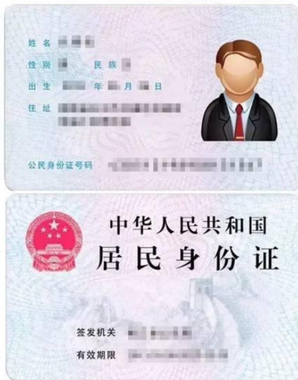
3 本人身份证正反面示例