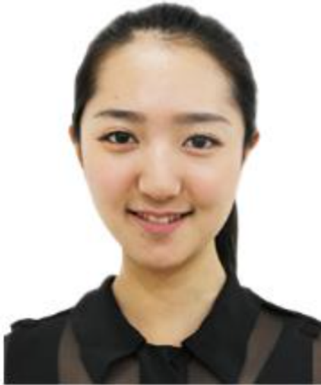
2 本人电子照片标准示例