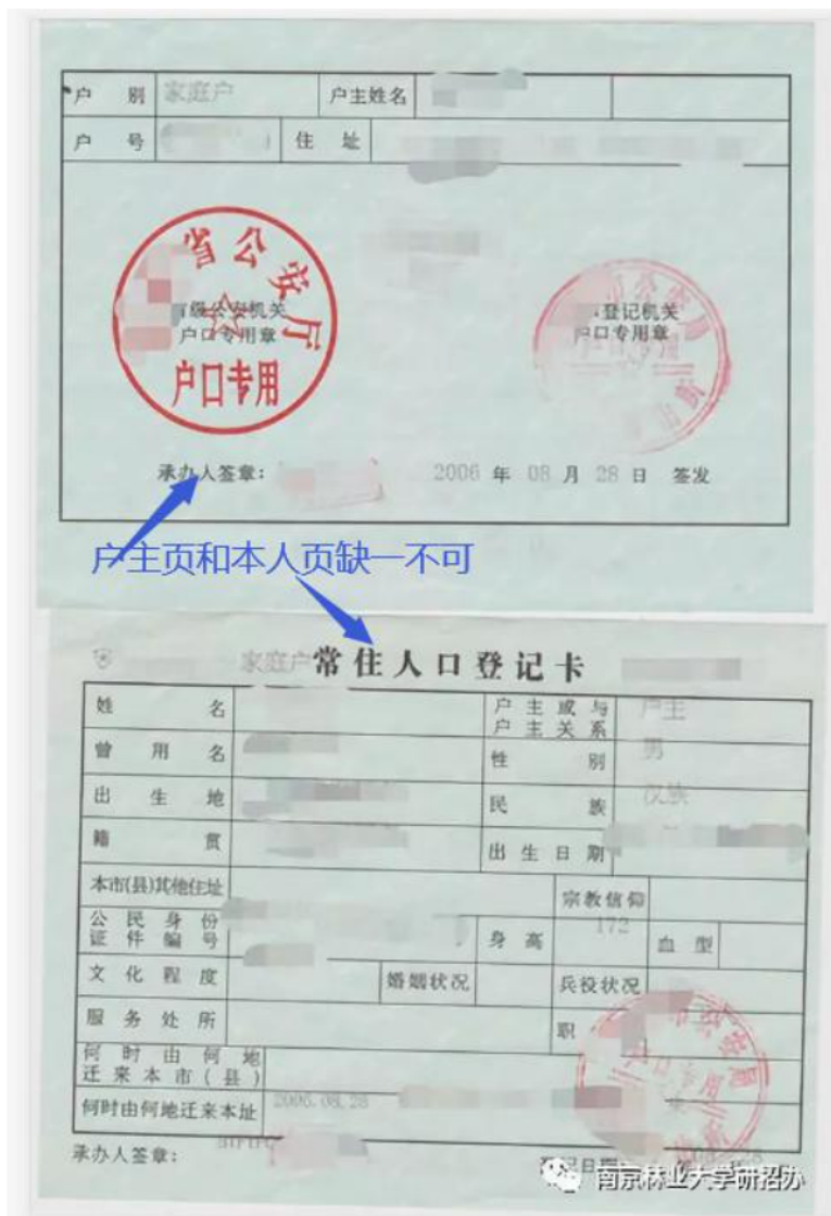
5-1 南京市户口本示例