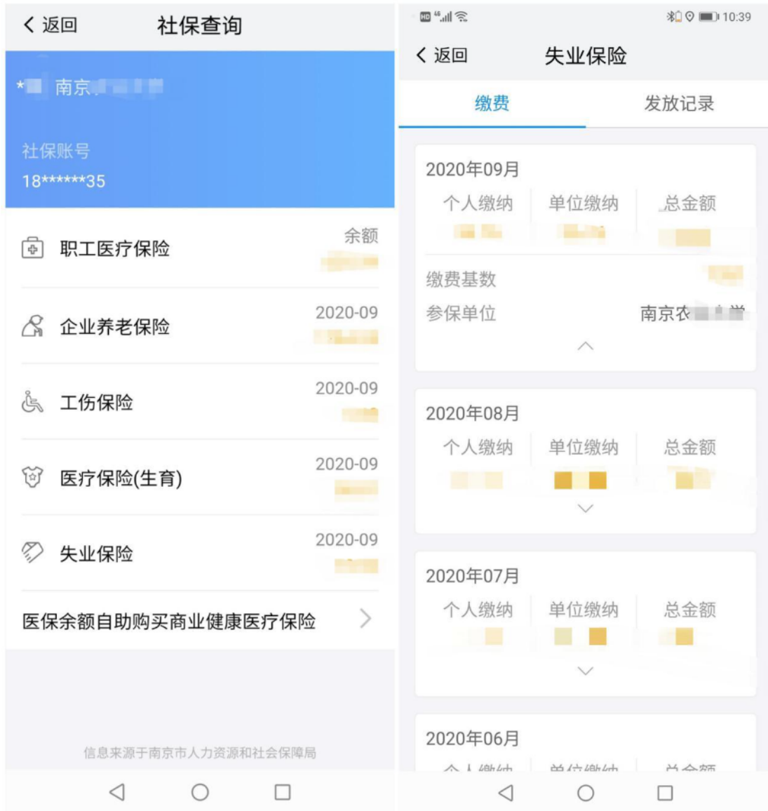
5-4 南京市参保证明示例(我的南京截图,要求有 2021 年 8-10 月缴费记录)